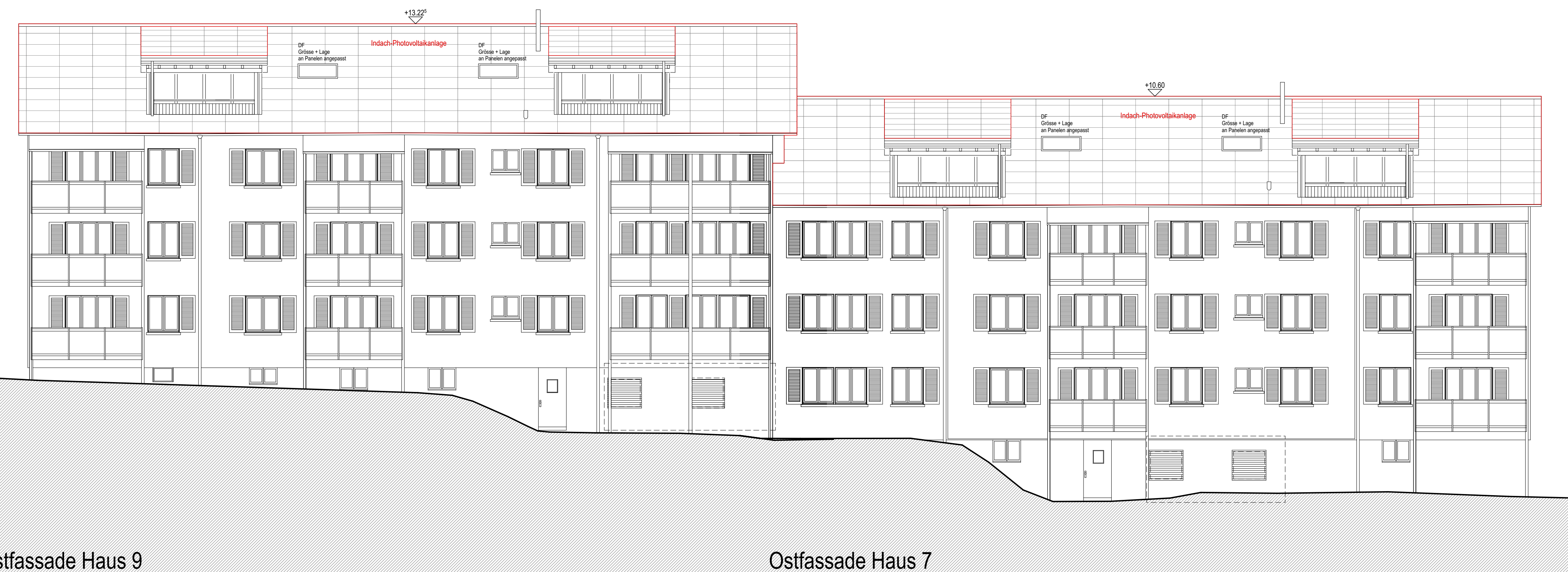
Ostfassade Haus 9