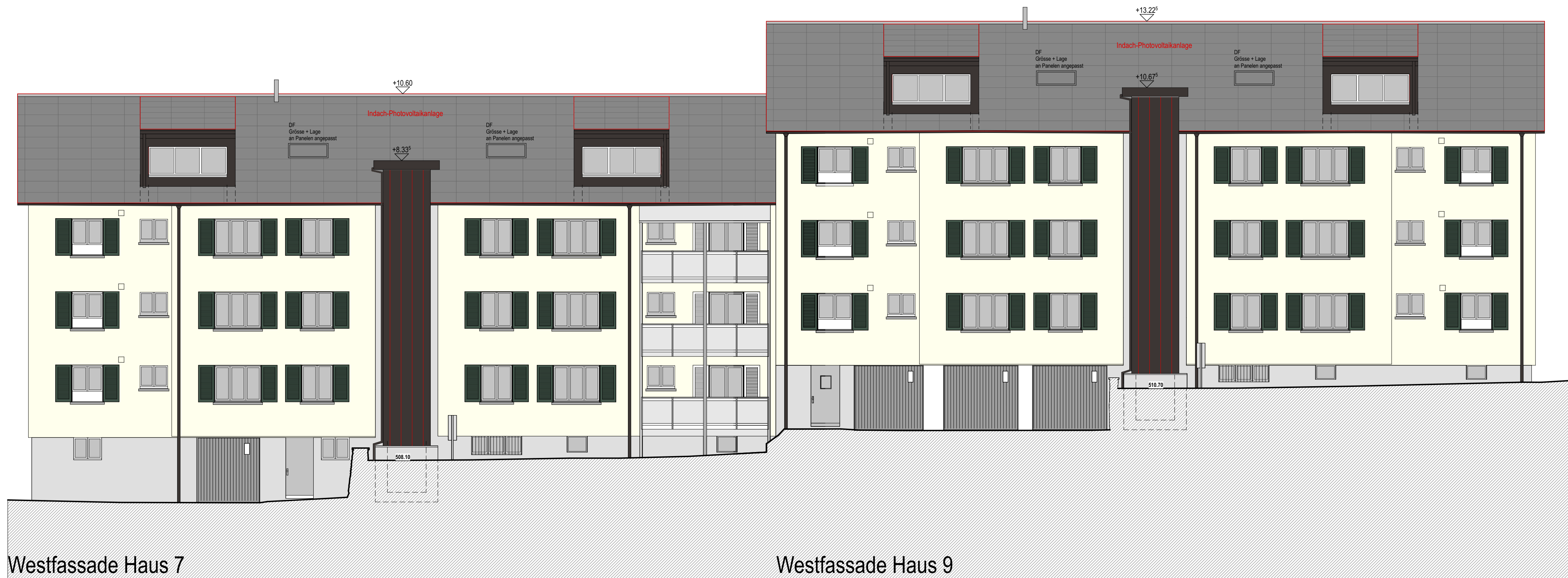
Westfassade Haus 7